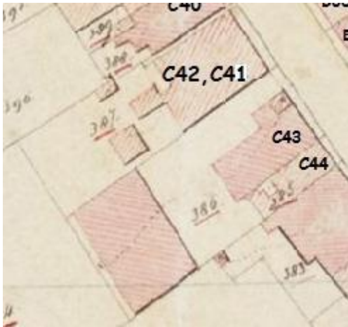
Kadaster 1832 OAT – W386 Wijk C huis 43

Het kadasternummer is slechts 2 keer gewijzigd, het huisnummer wel 9 keer maar sinds 1949 is het Blauwstraat 41.