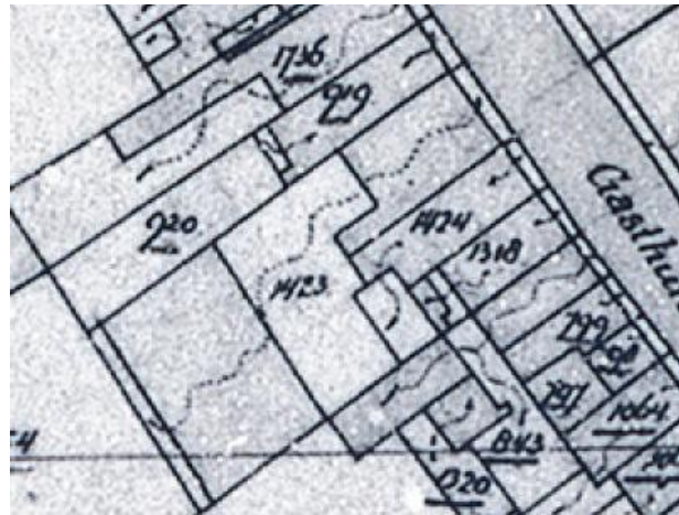
Kadaster 1906. Actueel W1423 Blauwstraat 41 W1424 Blauwstraat 39